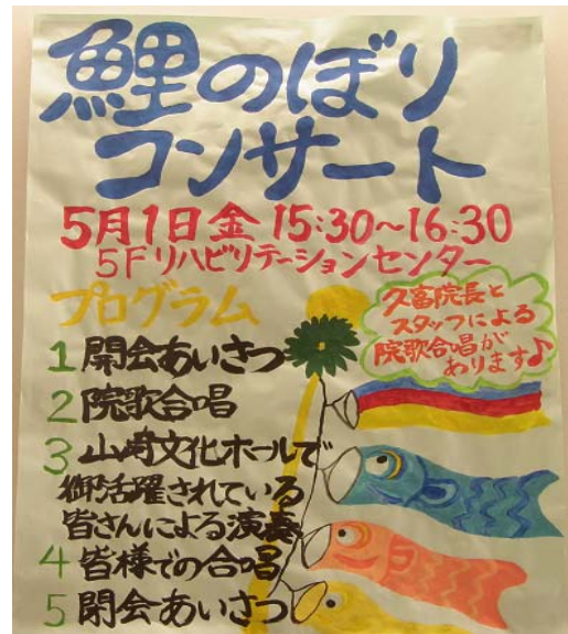
《本日のプログラムです》